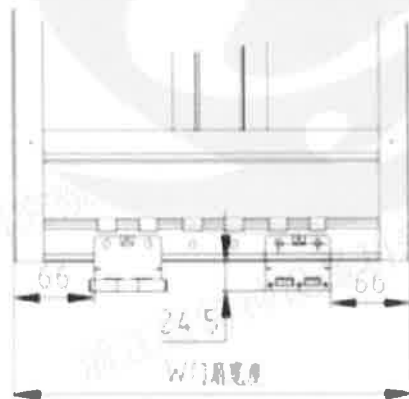
图3 下部导向和保持装置正视图